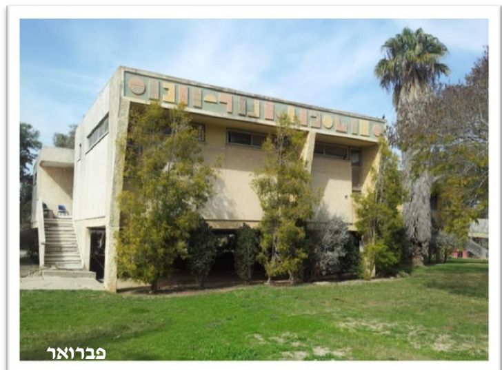
מבנה ציבור נטוש בלב קיבוץ נגבה

הגלעין הציבורי ההיסטורי והמבנים המשותפים שבו כמו חדר האוכל, בית העם ומגדל המים לצד מוזיאונים, ארכיונים ונכסי תרבות אחרים, מהווים יצירה אדריכלית ותרבותית יחידאית בתולדות ההתיישבות העובדת, ההולכת ומתרוקנת מתפקודה הקהילתיים. שימורם והתחדשותם מחייבים העמקה וחשיבה ציבורית מערכתית בטרם ימשיכו וישחקו כ"אבן שאין לה הופכין" בלב היישובים.