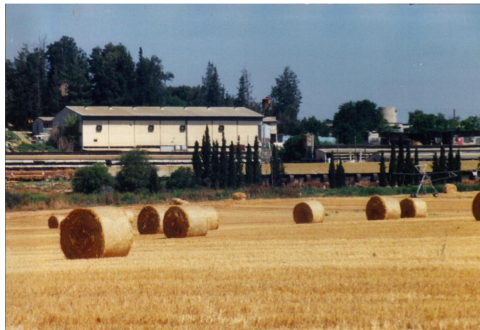
הכפר הישראלי קניין ותכנון - מיכה דרורי 21.3.18