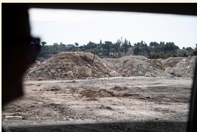
תיעוד השלכת עודפי עפר על ידי פעילים